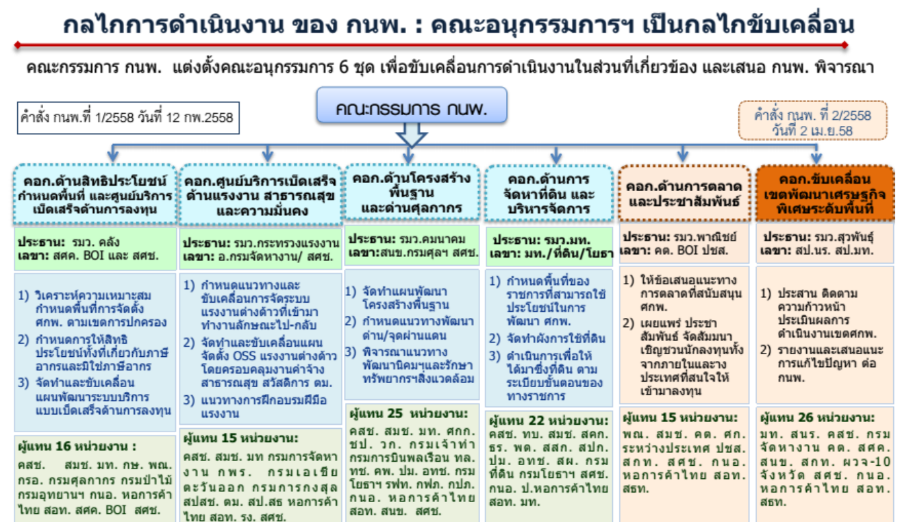
แผนภาพ ๑.๑ กลไกการดำเนินงานของคณะกรรมการนโยบายเขตพัฒนาเศรษฐกิจพิเศษ (กนพ.)

ต่อมา กนพ.ได้ออกประกาศกำหนดพื้นที่เขตเศรษฐกิจพิเศษใน ๑๐ จังหวัดทั่วประเทศ ๑๔ เพื่อให้มีการจัดตั้งและดำเนินการเขตเศรษฐกิจเป็นไปอย่างรวดเร็วและมีประสิทธิภาพ โดยพื้นที่ทั้งหมดเป็นไปตามที่ สศช. เคยศึกษาไว้ ประกอบไปด้วย จังหวัดตาก มุกดาหาร สระแก้ว สงขลา ตราด หนองคาย นครราชสีมา เชียงราย นครพนม และกาญจนบุรี โดยที่แต่ละจังหวัดต่างมีจุดเชื่อมโยงกับแนวระเบียงเศรษฐกิจ (Economic Corridor) และได้รับการสนับสนุนให้จัดตั้งเขตเศรษฐกิจพิเศษที่มีความแตกต่างกัน ดังจะได้กล่าวถึงในตอนที่สองต่อไป ทั้งนี้ กนพ. ได้ให้ความหมายเขตเศรษฐกิจพิเศษว่าเป็นพื้นที่ที่ กนพ. กำหนดให้เป็นเขตเศรษฐกิจพิเศษ ซึ่งรัฐจะสนับสนุนโครงสร้างพื้นฐาน สิทธิประโยชน์การลงทุน การบริหารแรงงานต่างด้าวแบบไป-กลับ การให้บริการจุดเดียวเบ็ดเสร็จ (one stop service) และการอื่นที่จำเป็น